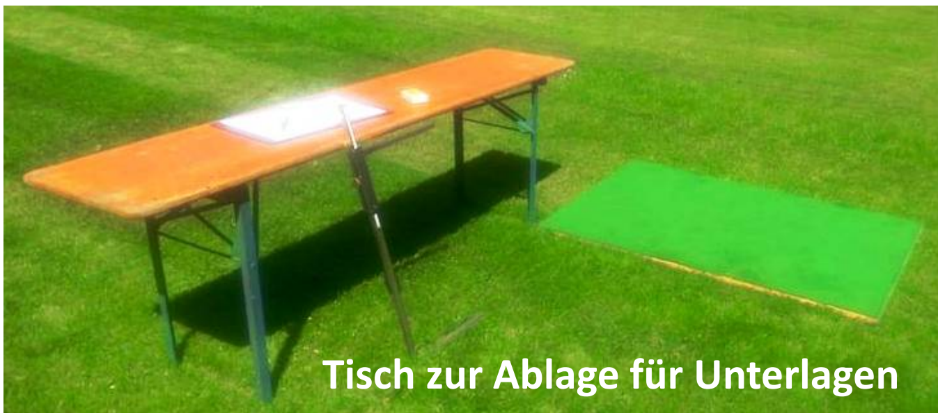
Tisch zur Ablage für Unterlagen